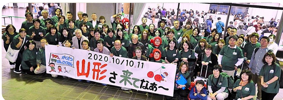
「2019.10.19視察 京都パルスプラザ」 山形をPR！

次のプロジェクト会議までに 具体的な配置計画や作業計画の立案 をし、業者に依頼する作業と要員によって作業することを仕分けた上で具体的な要員数を挙げたいと考えています。